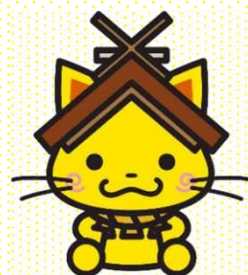
島根県観光キャラクター「しまねっこ」 島観連許諾第9101号