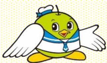
鳥取県マスコット キャラクター「トリビー」