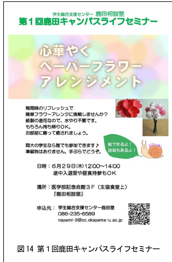
図 14 第 1 回鹿田キャンパスライフセミナー