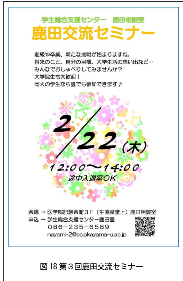
図 18 第3回鹿田交流セミナー