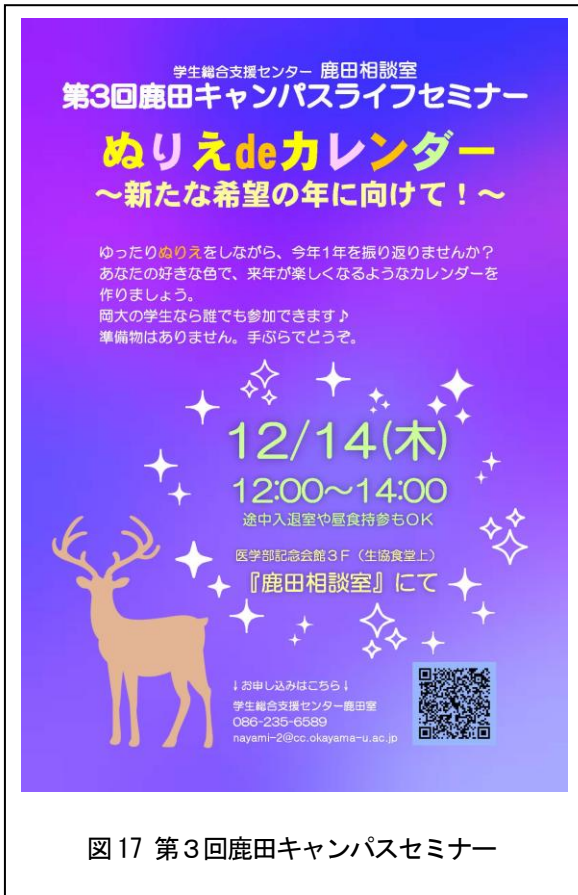
図 17 第3回鹿田キャンパスセミナー