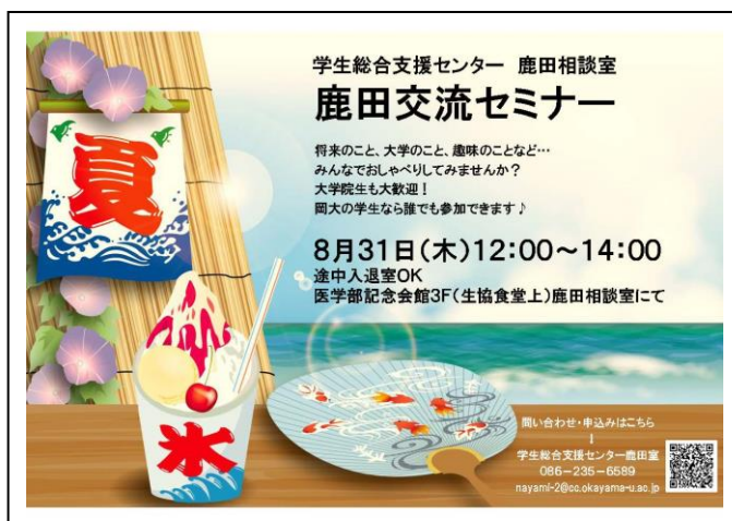
図 15 第 2 回鹿田相談室交流セミナー