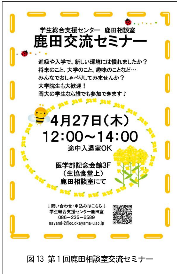
図 13 第 1 回鹿田相談室交流セミナー