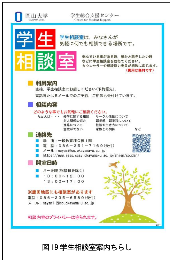
図 19 学生相談室案内ちらし