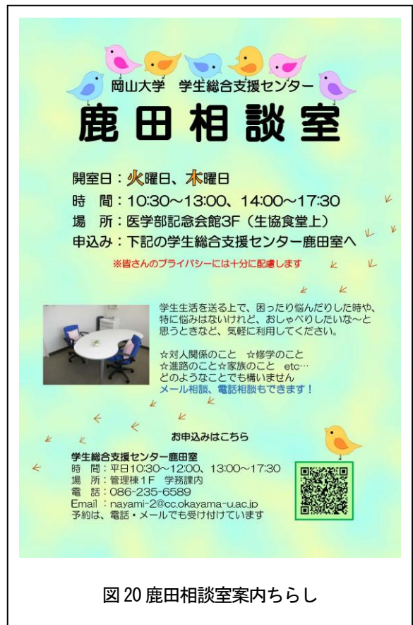
図 20 鹿田相談室案内ちらし